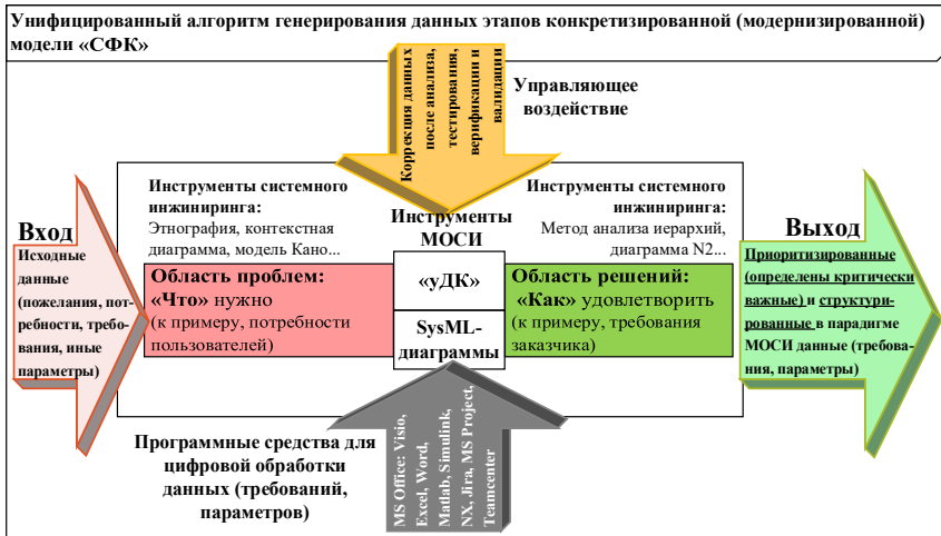
Рис. 3. Унифицированный алгоритм генерирования входных и выходных данных для этапов конкретизированной модели «СФК»

На основе конкретизации алгоритма «уСФК для уДК» было разработано пять алгоритмов, предназначенных для получения параметров ГП, ГЗ, ГИ № 1–4. Алгоритмы названы «уСФК для уДК № 0–4». В рамках каждого алгоритма: 1) получено описание физического смысла алгоритма, которое было формализовано (см. ниже пример формул (3) и (4)); 2) разработана рекомендованная структура шаблона модели «уДК № 0; 3») разработана концепция рамочного (обобщенного) алгоритма и определен порядок ее реализации.