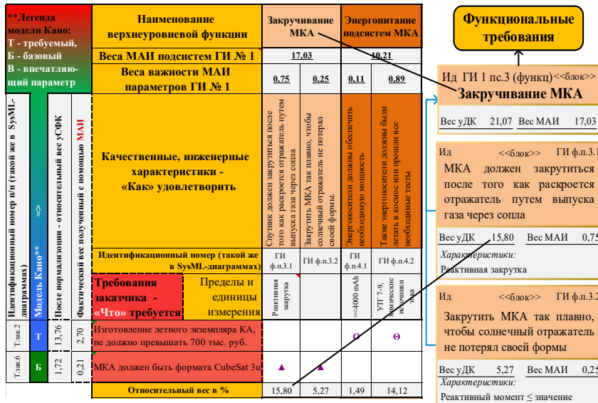
Рис. 8. Пример (сокращенный) синхронизации модели «усовершенствованный ДК № 1» с SysML-диаграммой требований

виды обеспечения CALS-технологий и позволяет повысить скорость реализации этапов ЖЦ проектирования будущих проектов на 5–10%.