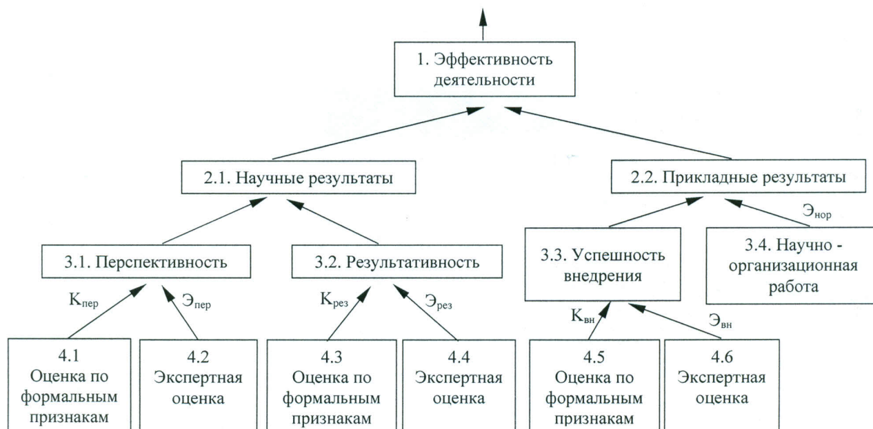
Рис. 1. Схема агрегирования исходных показателей в обобщенную оценку деятельности лабораторий